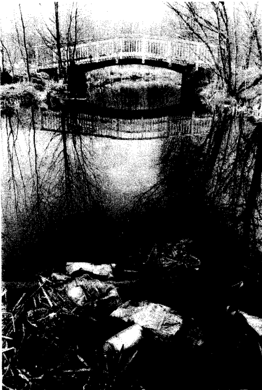
Vervuiling van het oppervlaktewater

g. het bij de afvalverwerking hanteren van dezelfde milieu-hygiënische normen die gelden voor andere bedrijfsmatige activiteiten ter bescherming van grond- en drinkwater, bodem en lucht. In het algemeen zal afval zo dicht mogelijk bij de bron waar het is ontstaan moeten worden verwerkt;