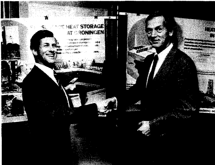
D66 oud-Europarlementarier Doeke Eisma bezoekt een energieproject in Groningen

III-8 Ten aanzien van de landbouw is het duidelijk dat zowel door de produktiebeperkende maatregelen die wij voorstaan als door de technologische en biologische ontwikkelingen, alsmede door de milieuvorschriften, in vele delen van de gemeenschap grote problemen kunnen ontstaan ten aanzien van inkomen en werkgelegenheid. Daarnaast zullen ook in een systeem, waarbij wordt gestreefd naar evenwicht op de interne markt, de belangen van moderne bedrijfsvoering strijdig kunnen zijn met de belangen van natuur en milieu. Deze nadelige effecten moeten worden bestreden door: