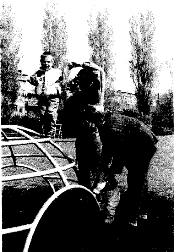
In gelijke mate deelnemen aan arbeidsproces en ouderschap

Economische zelfstandigheid van vrouwen en mannen moet uitgangspunt voor Europees beleid zijn