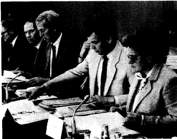
Europarlementariers in vergadering bijeen

verband. D66 acht humanitaire steun aan de democratische anti-apartheidsoppositie binnen Zuid Afrika alsmede aan het African National Congress (ANC) van wezenlijk belang om tot bovenbedoelde ontmanteling te komen. D66 bepleit dat paspoorthouders, die de Zuidafrikaanse nationaliteit bezitten alsmede de nationaliteit van één van de lidstaten, de laatstgenoemde verliezen, wanneer zij in het Zuidafrikaanse leger dienen.