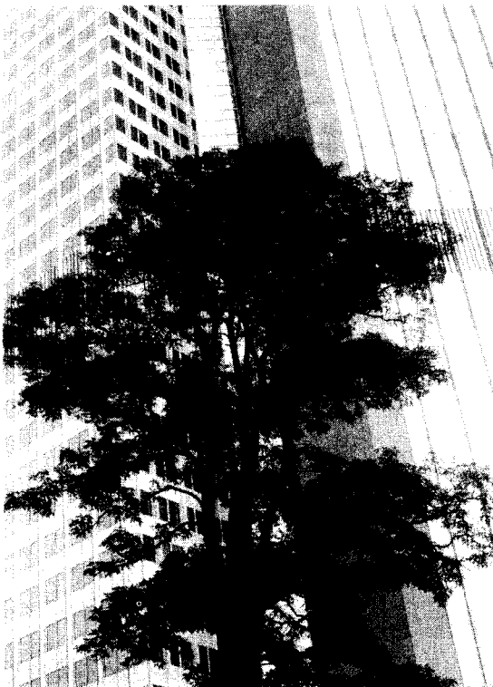
Meer aandacht voor woonmilieu

Nadruk op milieu- vriendelijke produktiemethoden