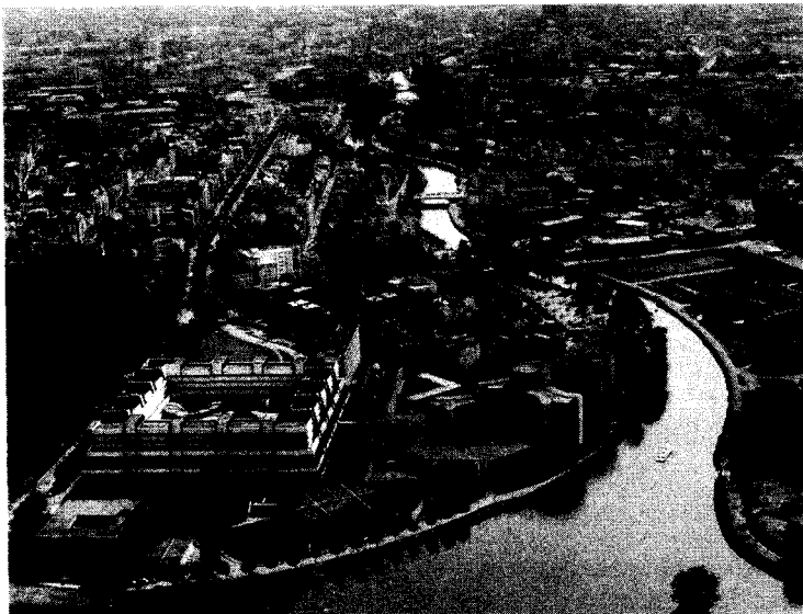
Gebouwen Europees Parlement te Straatsburg

verhoudingen tussen de EG-instellingen moeten dan ook worden aangepast, waarbij de positie van het Europees Parlement en van de Europese Commissie op korte termijn moeten worden versterkt ten opzichte van de Raad van Ministers. Voor het beter functioneren van het Europees Parlement is het noodzakelijk, dat het Europees Parlement, inclusief zijn diensten, in Brussel wordt geconcentreerd.