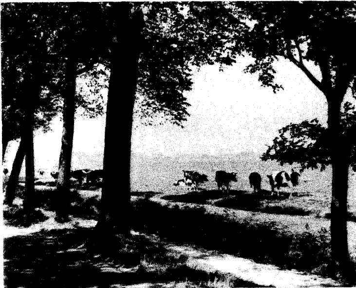
Milieuconsequenties voor de agrarische sector

vermijden, dient bovendien in alle lidstaten het principe van "de vervuiler betaalt" te worden toegepast;