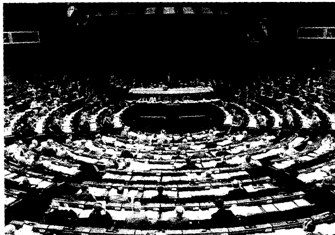
D66 verzet zich tegen het gebrek aan doorzichtigheid van de Europese besluitvorming.

25. Bij de intergouvernementele conferentie in 1996 ter herziening van de Europese verdragen behoren deze te worden uitgebreid met een aantal artikelen die de rechten van de burger direct garanderen (een zogenaamde Bill of Rights).