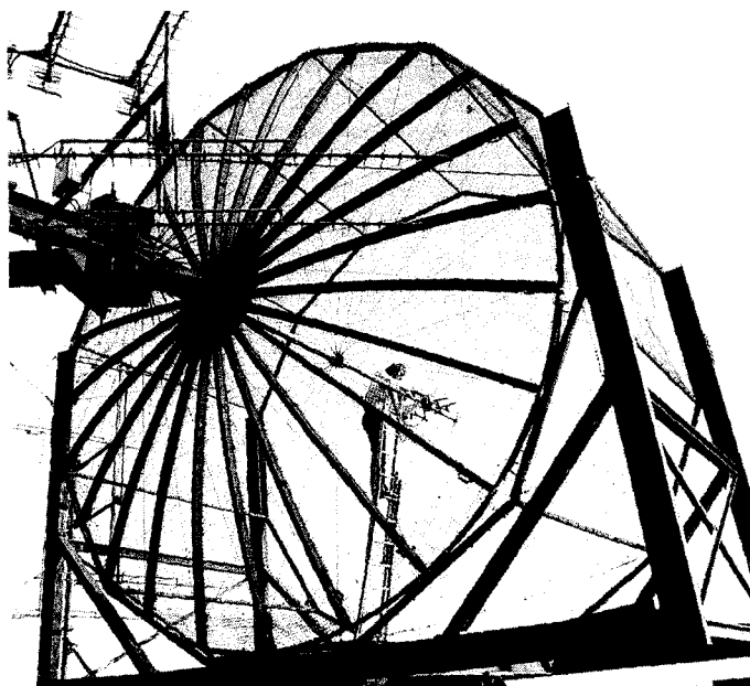
Bevordering van de infrastructuur, bijvoorbeeld telecommunicatie, is onderdeel van het Europees industriebeleid.

Daarnaast bevordert de EU de ontwikkeling van in economisch opzicht minder ontwikkelde regio's via het cohesiefonds en het Europees sociaal fonds.