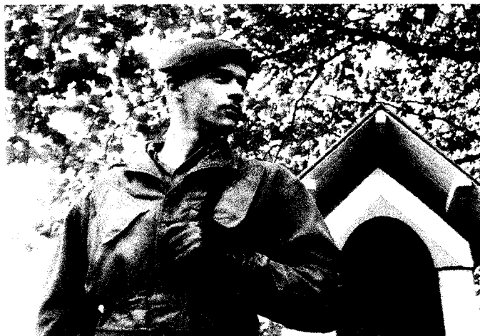
Nieuw beleid van de Europese Unie is onder meer het gemeenschappelijk buitenlands- en veiligheidsbeleid.

92. De EU moet op een verantwoorde manier om gaan met de haar ter beschikking gestelde middelen. Bestrijding van fraude verdient daarbij bijzondere aandacht. Het ontwikkelen van een geïntensiveerd anti-fraudebeleid is daarvoor van cruciaal belang.