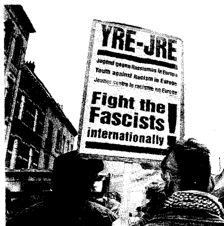
D66 vindt dat op Europees niveau moet worden samengewerkt om de maximale veiligheid voor de burgers die zich door extreem nationalistische en racistische uitingen, daden en/of bewegingen bedreigd voelen, te garanderen.

volgens ook de gevolgen van migratie goed worden opgevangen. Dat betekent dat van overheid en migranten en autochtonen inspanningen moeten worden gevraagd om de integratie van migranten te bevorderen. Het gaat daarbij niet alleen om integratie op sociaal-economisch terrein, maar ook om (wederzijdse) culturele integratie. Alleen dan kan een multi-etnische Europese samenleving ontstaan, op basis van participatie en volwaardig burgerschap van allen.