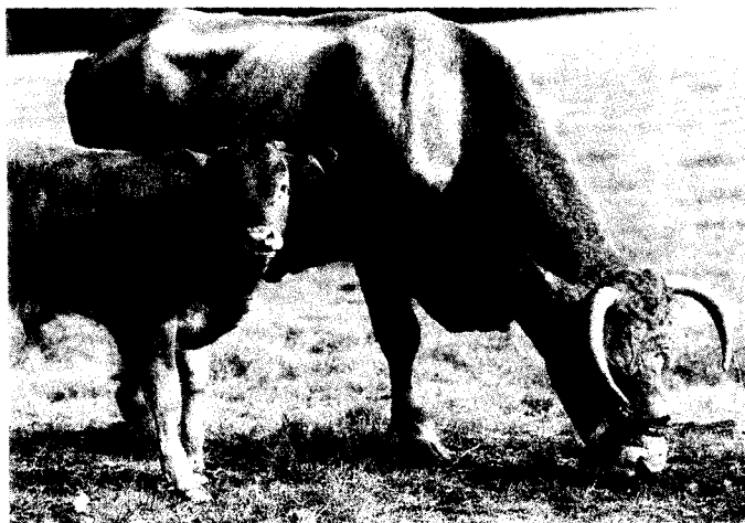
Milieuoverwegingen moeten een centrale rol krijgen in het Europees landbouwbeleid.

67. De grote financiële belangen die met het EU-landbouwbeleid gemoeid zijn maken het noodzakelijk dat fraude streng bestreden wordt. Het vereenvoudigen c.q. afschaffen van subsidies en heffingen kan er toe bijdragen dat fraude voorkomen wordt.