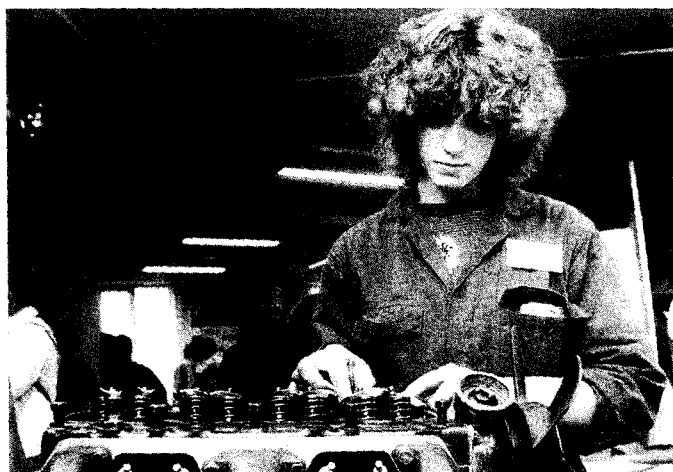
Om-, her- en bijscholing zullen een terugkerend onderdeel van de levensloop van de burgers van Europa worden.

60. De interne markt komt tot grotere bloei wanneer de economische ontwikkeling van de arme EU-landen toeneemt. Zolang nog grote verschillen tussen de arme en rijke EU-landen bestaan is een financiële inspanning, zowel in de vorm van leningen als van giften, van de rijkere EU-landen vereist om de samenhang (cohesie) van de Unie te bevorderen. Het cohesiebeleid moet er vooral op gericht zijn de achterstand van de armere EU-landen wat investeringen in milieuvriendelijke productieprocessen betreft op te heffen.