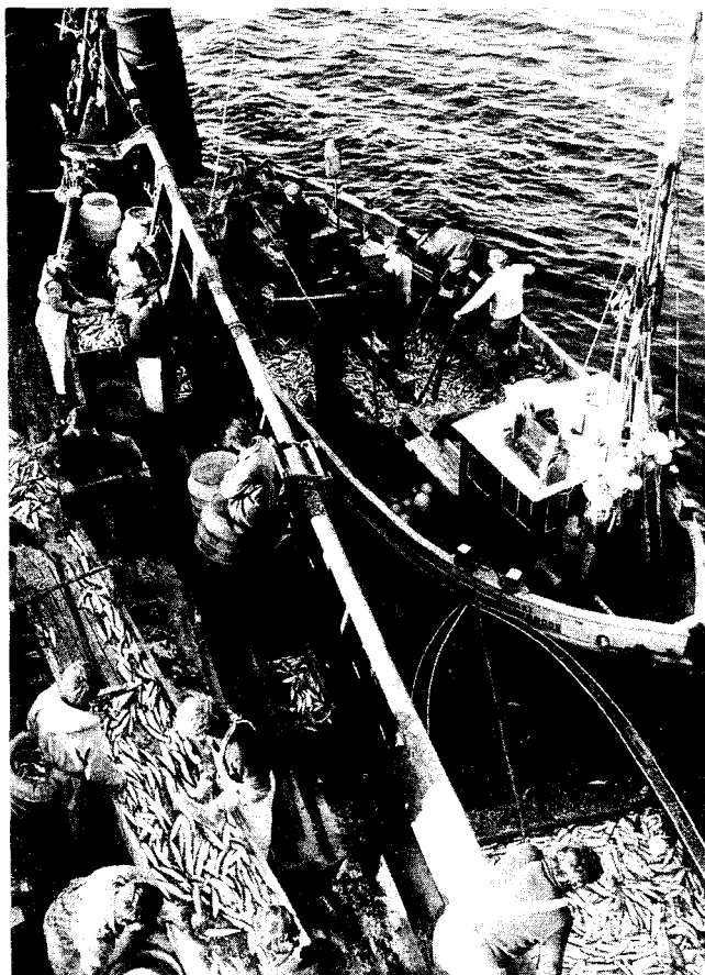
Het vissen in Europese wateren door niet-lidstaten (hier een Oostduits schip) moet drastisch worden beperkt.

voorkomen en dus niet overbevist zijn, moet bevinging binnen redelijke grenzen mogelijk gemaakt worden.