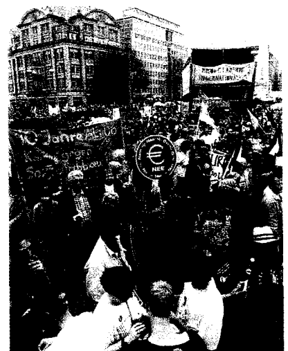
▲ 50.000 mensen demonstreren in Amsterdam tegen Euro en bezuinigingen

Het Europees Parlement mist bevoegdheden die normale parlementen wel hebben. Dat maakt dat fallende leden van de Europese Commissie niet met een enkelvoudige meerderheid kunnen worden weggestemd. De SP vindt niet dat versterken van de macht van het Europees Parlement ten koste mag gaan van de democratische besluitvorming op lagere niveaus. De SP wil democratiseren door te decentraliseren. Wij zijn tegen verdere overdracht van geld en macht vanuit Den Haag naar Brussel. Veel van de bevoegdheden die reeds uit handen zijn gegeven, kunnen beter