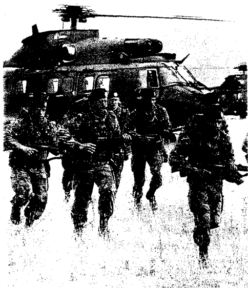
▲ Militaire grootmacht spelen: de NAVO als politieagent van de wereld

worden uitgeoefend op lagere niveaus, waar de beslissers de hete adem van de mensen en hun organisaties in hun nek voelen. In plaats van een Europese superstaat waarin ergens ver weg over de politiek wordt beslist, willen we dat beslissingen zo dicht mogelijk bij huis worden genomen: door de Tweede Kamer, de gemeenteraad, de fabrieksvloer, de buurt.