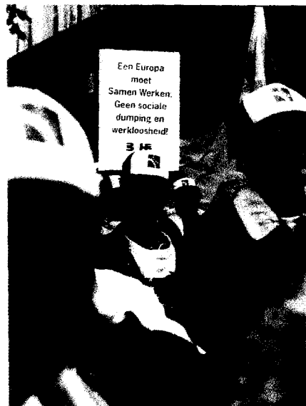
▲ De Europese economische eenwording leidt tot verslechteringen voor de werkende mensen.

Volgens de SP is het in werkelijkheid echter precies andersom: de Europese Unie wil de eenentwintigste eeuw ingaan met negentiende-eeuwse methodes. Door het ontstaan en de versterking van die unie dreigen we terug te vallen in de machts- en inkomens-verhoudingen van een eeuw geleden, waarvan we dachten dat we die allang achter ons gelaten hadden. Toen hield de overheid zich niet bezig met het inkomen en de voorzieningen voor gewone mensen, en hadden die mensen ook geen enkele zeggenschap over de overheid. De staat was er alleen voor de bevoorrechten en beperkte zich tot oorlog, openbare orde en belastingheffing. De afgelopen eeuw is er volop strijd gevoerd voor democratisering, bestuurlijke schaalverkleining, collectieve voorzieningen en sociale zekerheid. Allemaal middelen om de mensen van onderop zélf te laten beslissen over hun levensomstandigheden in plaats van dat over