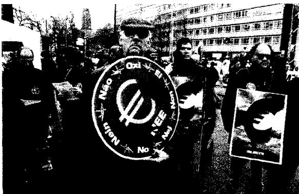
▲ 1997: De SP in actie tegen invoering van de euro

De Europese Centrale Bank mist politieke sturing en controle. De ECB-directie is de kleinste heersende elite sinds de Middeleeuwen. Haar leden worden bijeengehaald uit de bovenste lagen van één enkel beroep: zij zijn geen vertegenwoordigers van vakbonden, minderheidsgroepen, middenstanders of boeren. Er zijn zelfs geen juristen, ingenieurs of andere wetenschappers bij, maar alleen bankiers. Een eeuw geleden werd de wereld ook geleid door rijke mannen. In hoge mate is dat nog steeds zo, maar een eeuw van democratische vooruitgang heeft tenminste iedere Nederlandse burger boven 18 jaar, man of vrouw, blank of zwart, het recht gegeven om te stemmen op mensen die beloven hun belangen te vertegen-