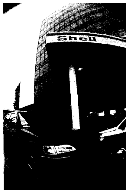
▲ De echte bazen in Europa zijn de multinationals

Alles wat de mensen met de laagste inkomens beschermt, zien zij als het 'belemmeren van de markt en de vrije concurrentie'. Veel Europese regels zijn dan ook bedoeld voor 'het bevorderen van de vrije concurrentie'. Waar vroeger een democratisch controleerbare instelling een maatschappelijk nuttige taak verzorgde, zoals de spoorwegen, gemeentelijke nutsbedrijven, de PTT, ziekenfondsen, uitvoeringsorganisaties voor de sociale zekerheid en omroepverenigingen, moet nu ruimte worden geschapen voor elkaar beconcurrerende commerciële ondernemingen. Ondernemingen die proberen daarmee voor zichzelf zo veel mogelijk winst te maken. Alle kwalen die zich vanouds voordoen in het particuliere bedrijfsleven, zoals chaos, slechte dienstverlening, ontslagen