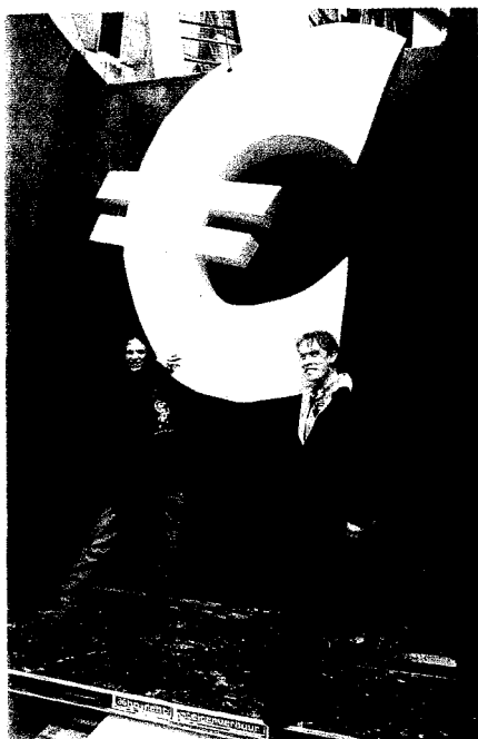
▲ De Euro is geen vakantiemunt, maar een bezuinigingsafpraak

De SP kan net zo min als anderen voorspellen of het uiteindelijk met de euro goed of fout zal gaan, maar we vinden het onverantwoord om nu maar net te doen alsof het vaststaat dat alles wel goed komt. De euro komt er op een moment dat het een aantal jaren naar verhouding goed is gegaan met de Europese economie, maar het moet nog worden aangetoond hoe die zich houdt in een toestand van stagnatie of crisis. Als de Europese autoriteiten blijven weigeren aan afzonderlijke landen toe te staan om maatregelen te nemen voor de bescherming van hun inwoners, gaat het mis. In de publieke opinie is er dan geen plaats meer voor 'Euro-forie'. De EU-lidstaten Denemarken en Zweden hebben al bij voorbaat dit risico niet willen nemen en doen tot op heden niet mee. We moeten er dan ook rekening mee houden dat deze munt kan mislukken. Er zijn vaker munten van grote staten waardeloos geworden. In dat geval moet er voor Nederland (en andere landen) tijdig een nationaal crisisplan gereed liggen voor de terugkeer van de eigen munt. Herinvoering van de gulden – en van andere munten in onze buurlanden – moet dan snel mogelijk zijn om chaos en verarming te voorkomen.