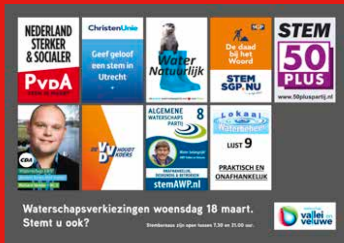
dit posterformaat is 63 x 88 cm

Hiernaast ziet u een voorbeeld van een opkomstbevorderingscampagne.