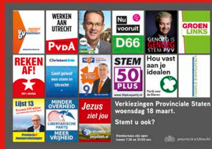
dit posterformaat is 53 x 73 cm

Waterschapsverkiezingen woensdag 18 maart. Stemt u ook?